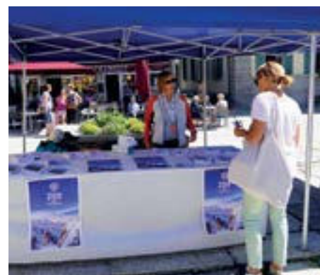
Animations Place du Triangle de l'Amitié