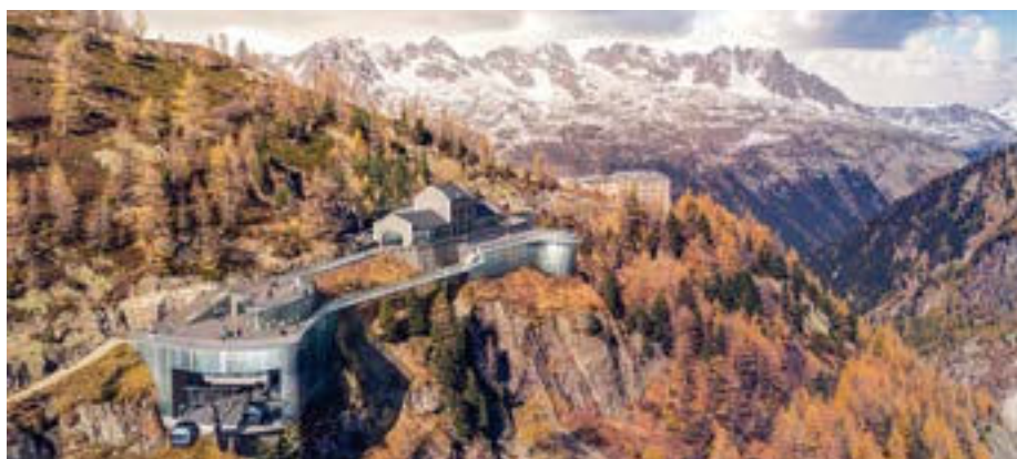
Préfiguration Gare Amont du Montenvers et Glaciorium