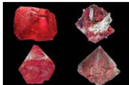
Musée des Cristaux - Fluorites du Mont-Blanc

collection exceptionnelle de fluorites roses et rouges du Mont-Blanc, trésor alpin unique au monde. Ainsi que toute la riche variété de minéraux de l'Arc Alpin, faisant de cette exposition dédiée un point d'excellence de niveau international. Le musée invite ensuite à explorer l'extraordinaire diversité minéralogique de la France, son passé minier et ses sites majeurs, suivi d'un grand tour du monde coloré des minéraux des cinq continents. Nouveauté : le « Trésor », où seront présentés gemmes, pierres taillées et métaux natifs (or, argent, cuivre). Sur une surface d'exposition de 700 m 2 , près de 1400 spécimens émerveilleront passionnés et curieux de tous âges. Ce nouveau musée des Cristaux, agrandi et réaménagé, se classe désormais parmi les plus beaux musées minéralogiques nationaux.