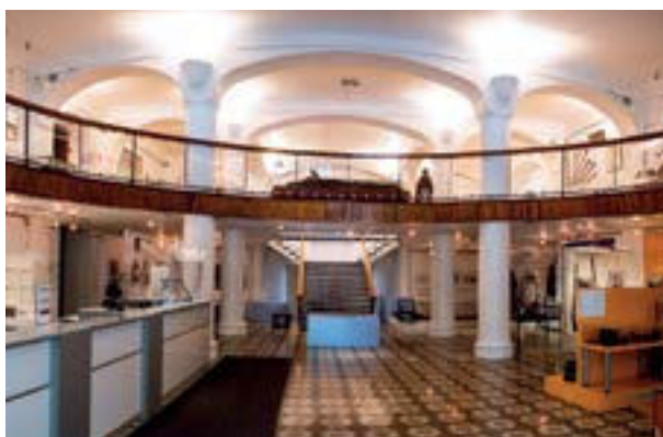
Musée Alpin, détails

principaux : valoriser notre formidable patrimoine naturel et culturel et proposer un véritable outil de diversification touristique. L'opération officiellement lancée ce printemps 2021, prévoit l'agrandissement du site actuel et sa rénovation complète : création de 3 espaces d'exposition permanente et d'un espace d'exposition temporaire, nouvelle muséographie, nouveaux dispositifs de médiation, important développement du numérique, etc. La rénovation représente un investissement de l'ordre de 7M€.