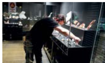
Vitrine en cours d'installation