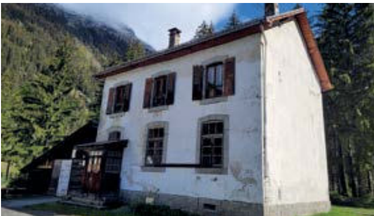
Les Grassonnets (ancienne école)