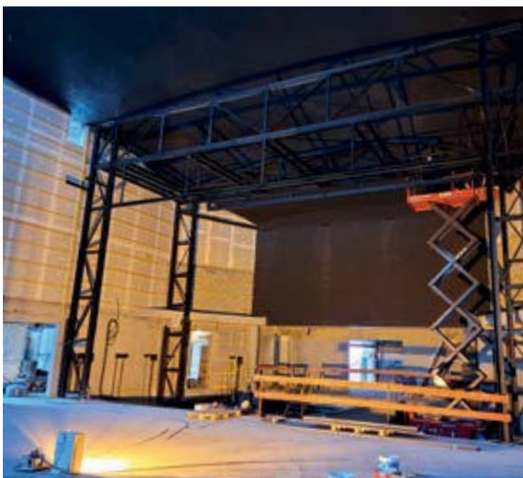
Espace culturel en construction