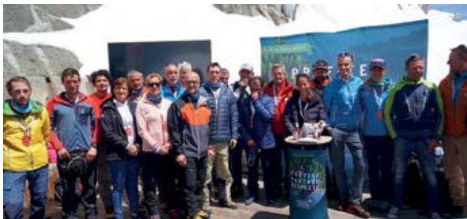
Partenaires de la Plus grande cordée au monde

Retrouvez tout le programme sur chamonix.com et chamonix.fr .