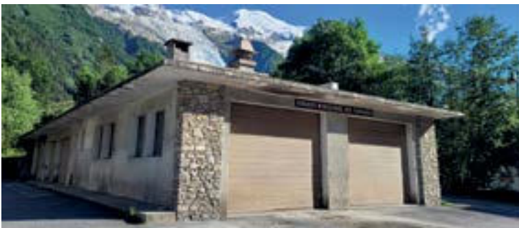
Les Favrand (anciens ateliers municipaux)

Cette adhésion à la société de coordination permettra à la SAEM Chamonix Logement de bénéficier d'un réseau, de moyens et partenariats tout en conservant sa personnalité morale et ses prérogatives, et d'envisager ainsi des coopérations plus fortes : politiques d'achat commun, solidarités de gestion, avances et prêts entre membres... La SAEM Chamonix Logement, créée en 2004 permet à la commune de Chamonix, actionnaire majoritaire parmi 13 dont 11 employeurs de la Vallée de gérer une résidence sociale de 56 logements saisonniers suite à la transformation d'une ancienne résidence de vacances.