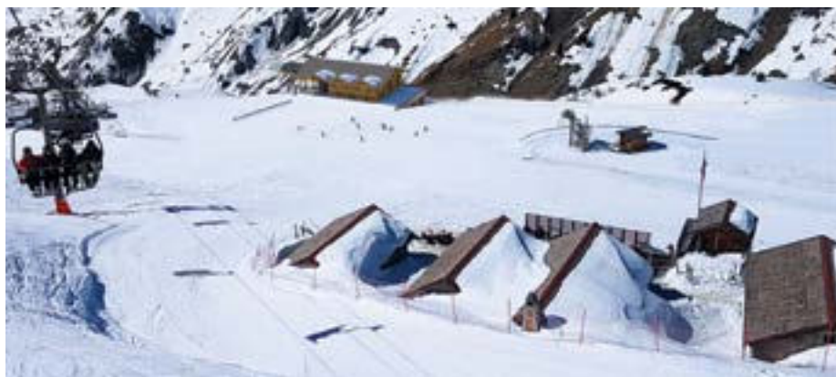
Préfiguration Gare Amont de Charamillon

Pour sa mise en œuvre un contrat de concession de service public d'une durée de 33 ans a été conclu le 25 juin avec la Compagnie de la Mer de Glace, respectivement détenue par la Compagnie du Mont Blanc (60%), la Caisse des Dépôts et des Consignations (30%) et le Crédit Agricole des Savoie (10%). Il prévoit la mise en service de la nouvelle télécabine Mer de Glace en décembre 2023 et l'ouverture du CIGC en décembre 2024.