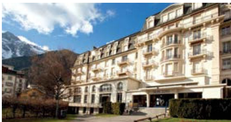
Musée Alpin, détails