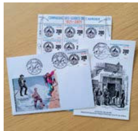
Timbres et cartes 200 Ans des Guides