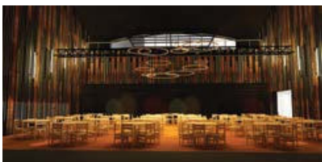
Préfigurations 3D de la nouvelle salle