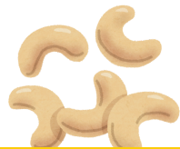
Noix de cajou